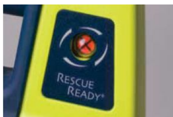
Technologia Rescue Ready®